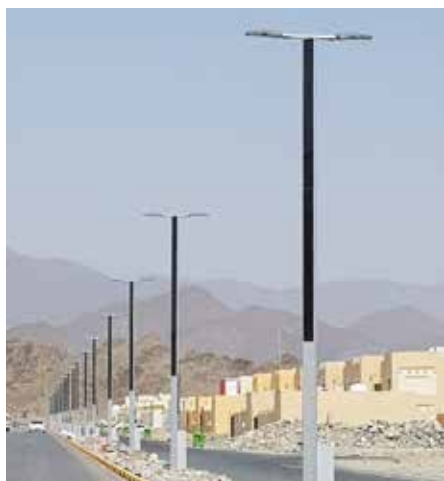
Suncil® Triangular Kalba, EAU