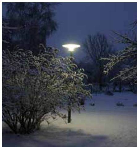
Asima® Sun Autónomo, en cooperación con el municipio de Græsted, Dinamarca