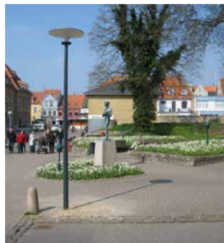
Asima® Sun, Grid Connect Conectado a la red, en cooperación con el municipio de Sønderborg, Dinamarca