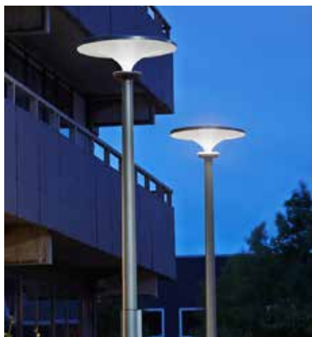
Asima® Sun, Standalone Autónomo, en cooperación con el laboratorio danés de iluminación exterior, Dinamarca