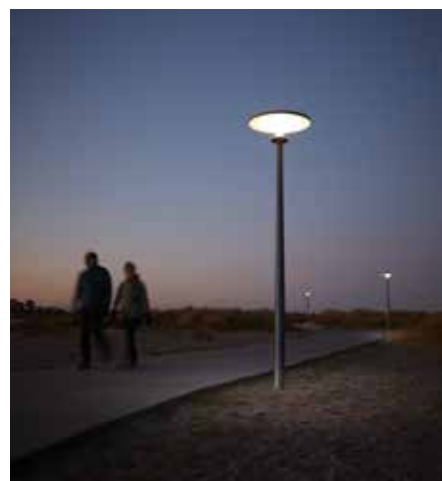
Asima® Sun Amager Strandpark, Copenhague, Dinamarca