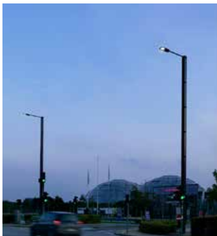
Monopole Randers, Dinamarca