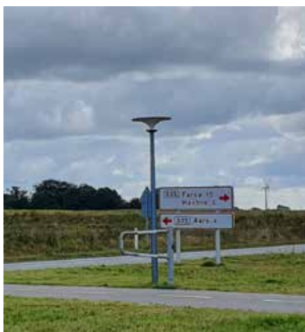
Asima® Sun Municipio de Aars, Dinamarca