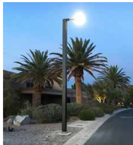
Monopole Autónomo en colaboración con Macdonald Highlands, Nevada