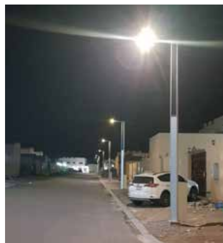
Suncil® Triangular Barrio des villas d'Al Safa, EAU