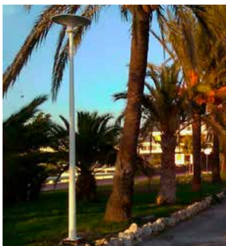
Asima® Sun, Grid Connect Conectado a la red. En cooperación con el municipio de Cannes, Francia