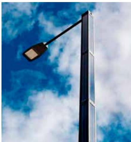
Monopole, Grid Connect Conectado a la red, en cooperación con el municipio de Ebeltoft, Dinamarca