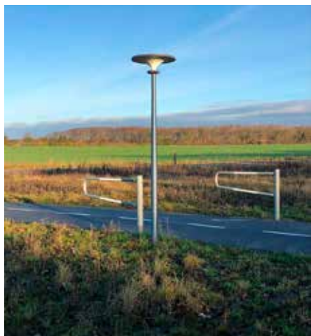
Asima® Sun, Standalone Autónomo, en cooperación con Vesthimmerland, Dinamarca