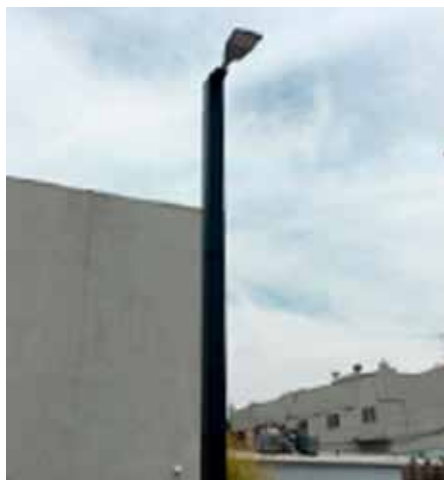
Monopole Autónoma y monopolista, en cooperación con la ciudad de Los Ángeles