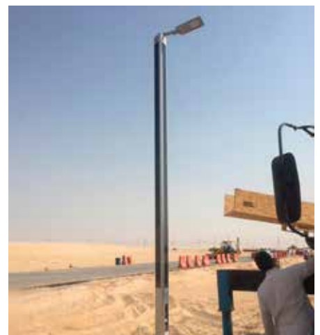
Suncil® Triangular Dammam, Arabia Saudita