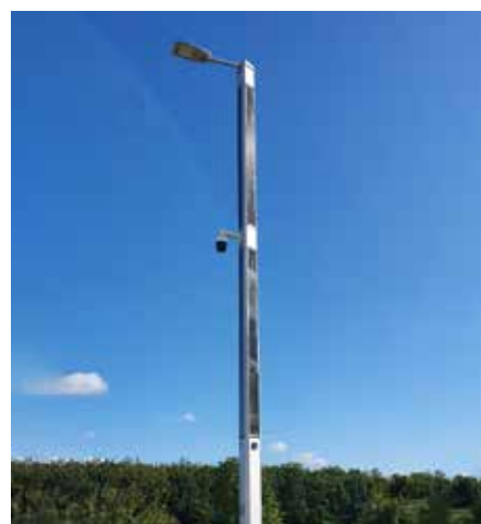
Suncil® Triangular, 8m Randers, Dinamarca