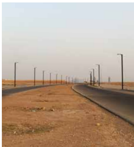
Monopole, Standalone Région Medio Oriente