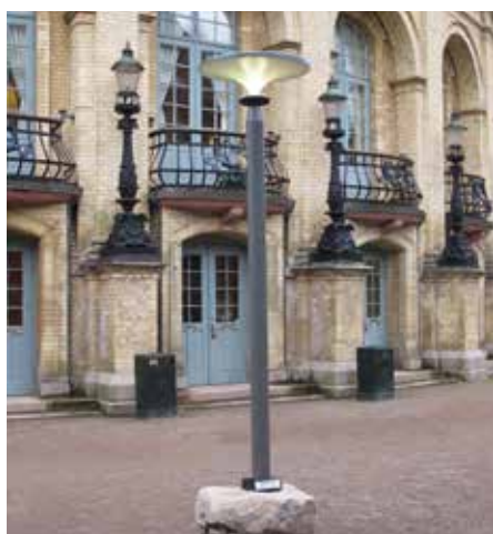
Asima® Sun En cooperación con el municipio de Landskrona, Suecia