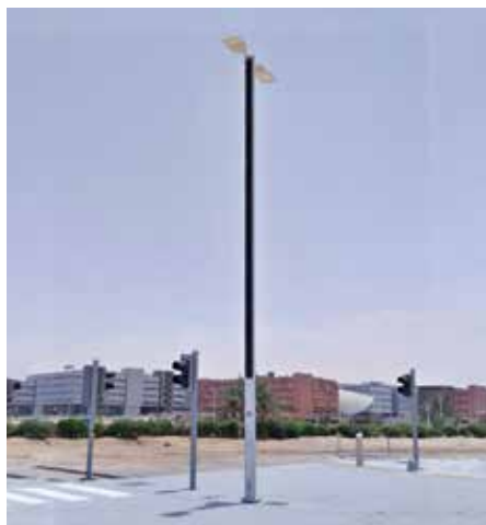
Suncil® Triangular Columnas solares elevadas para un bulevar, EAU