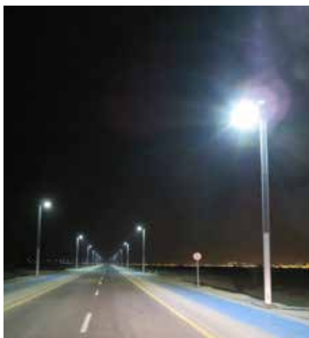
Suncil® Triangular Región Occidental, EAU