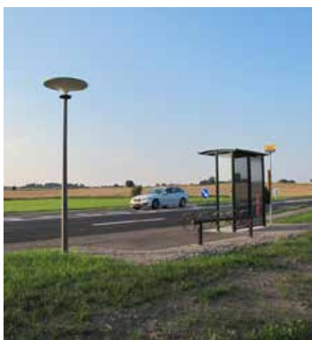
Asima® Sun, Standalone Autónomo, en cooperación con la municipalidad de Gribskov, Danemark