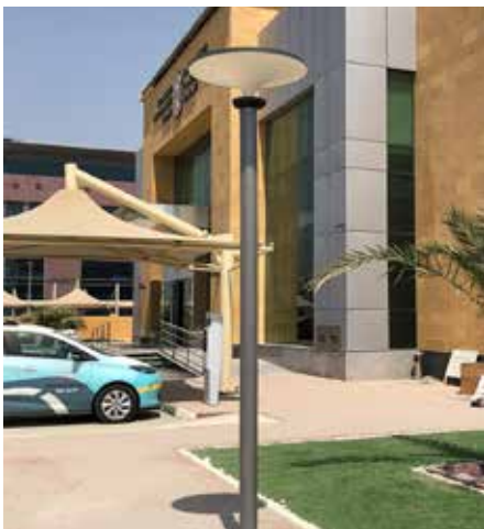
Asima® Sun & Asima® Bollard®, Standalone Autónomo, en cooperación con el Ministerio de Desarrollo de Infraestructura de Fujairah, EAU