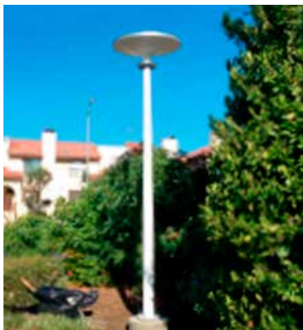
Asima® Sun, Standalone Autónomo, en cooperación con la Asociación de propietarios de viviendas de California