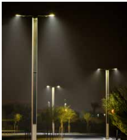
Suncil® Triangular Sujetadores dobles, iluminando un carril de bicicletas, EAU