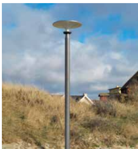
Asima® Sun, Standalone Autónomo, en cooperación con el municipio de Varde, Dinamarca