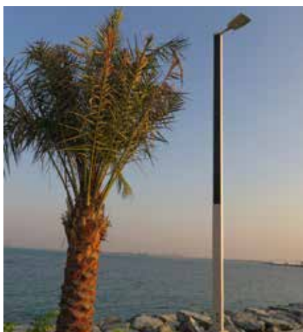
Suncil® Triangular Región Occidental, EAU