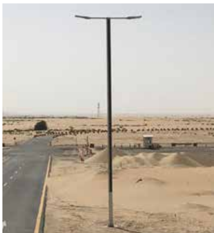
Suncil® Triangular, 12m Arabia Saudita