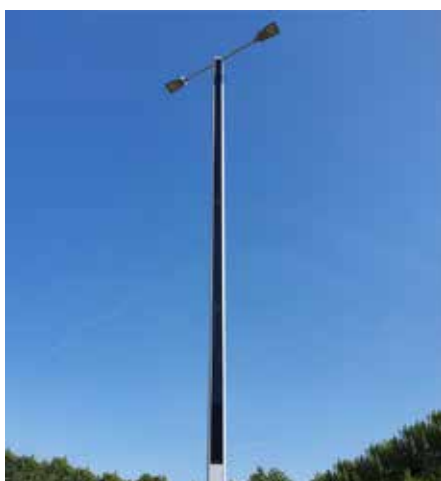
Suncil® Triangular, 12m Randers, Dinamarca