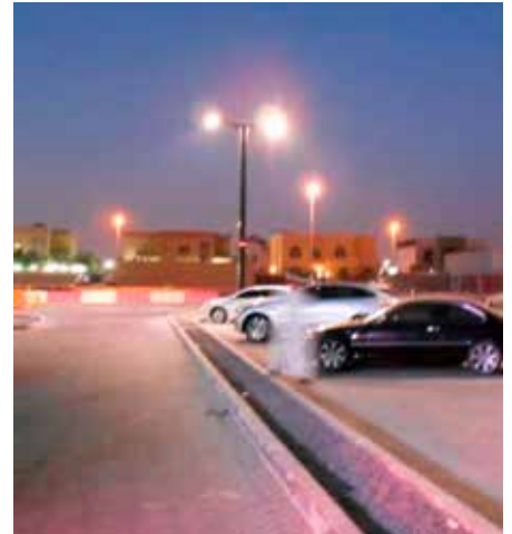
Monopole, Standalone Autonomo, En cooperación con DEWA, EAU