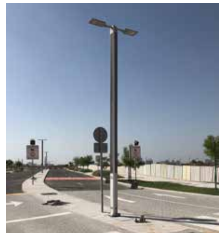
Suncil® Triangular Iluminando una ruta escolar, EAU