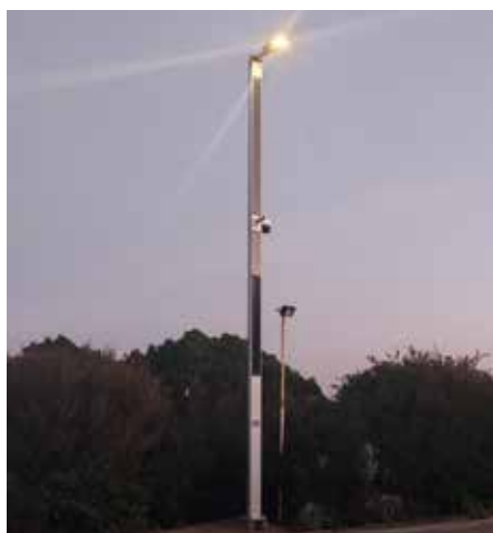
Suncil® Triangular Estela Golf Club, Portugal