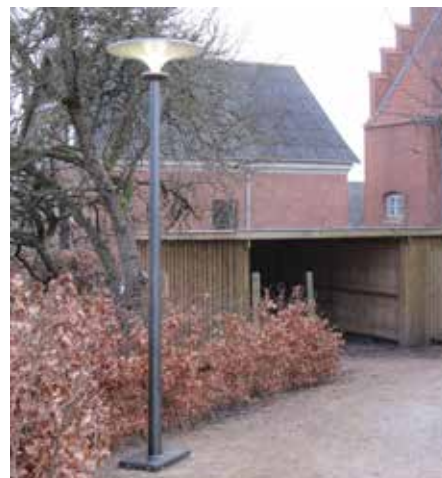
Asima® Sun En cooperación con el municipio de Tølløse, Dinamarca