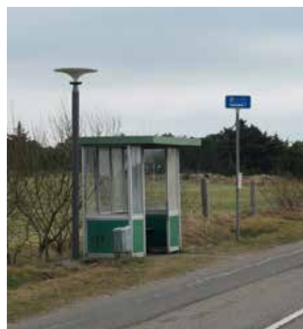
Asima® Sun, Standalone En cooperación con el municipio de Fanø, Dinamarca