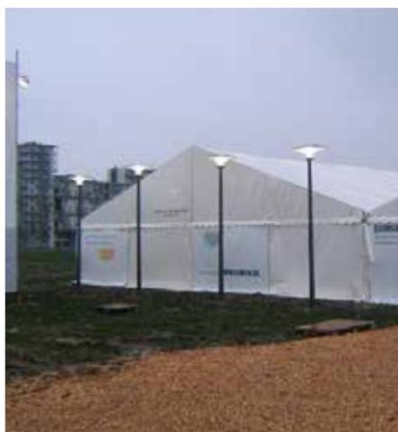
Asima® Sun En cooperación con COP15 Copenhague, Dinamarca