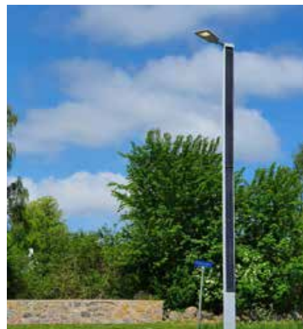
Suncil® Triangular Holbæk, Dinamarca