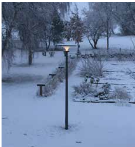
Asima® Sun En cooperación con Lyhne Design, Dinamarca