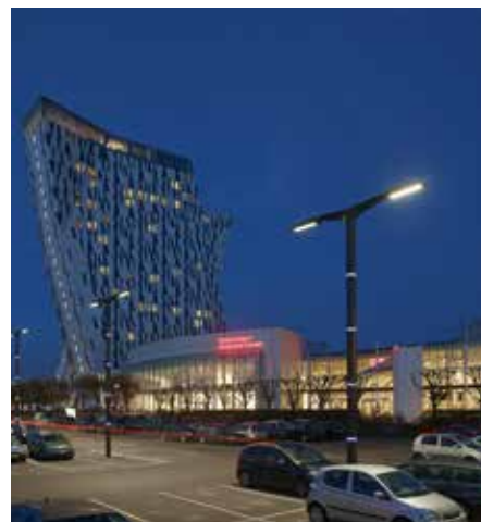
Monopole, Grid Connect Conectado a la red, Bella Center Copenhagen, Dinamarca