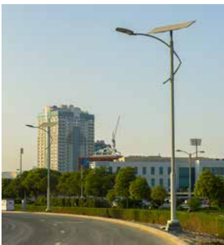
Flatpanel Solution, Stand Alone Autonomo, En cooperación con Dubai Sports City, EAU