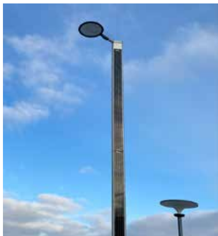
Suncil® Triangular, 6m Randers, Dinamarca