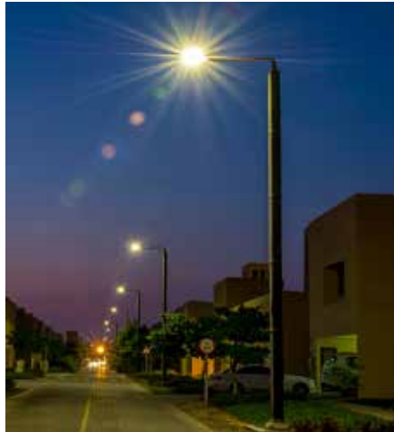
Monopole, Stand Alone Autónomo, en cooperación con el municipio de Abu Dhabi, EAU