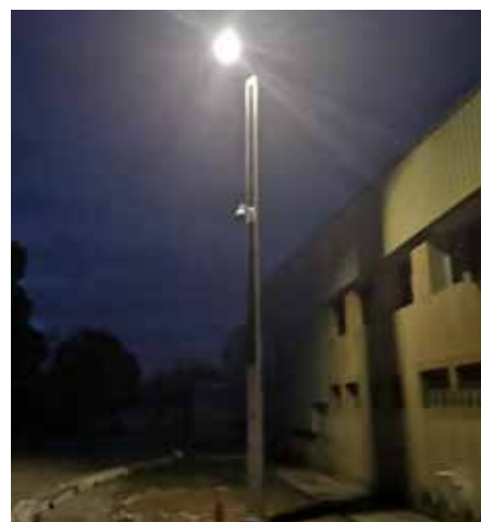
Suncil® Triangular Saint-Rémy-de-Provence, Francia