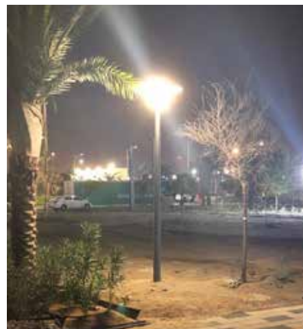
Asima® Sun Abu Dhabi, EAU