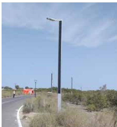
Suncil® Triangular Isla Al - Aryam, Emiratos Árabes Unidos