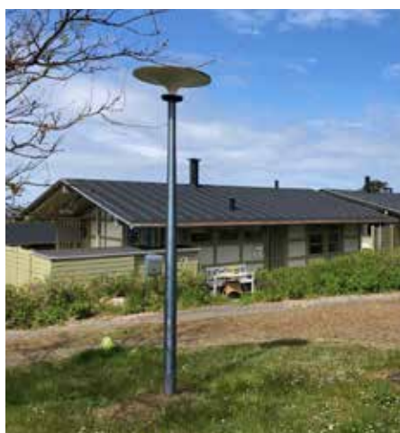
Asima® Sun Gilleleje - Pueblo de vacaciones, Dinamarca