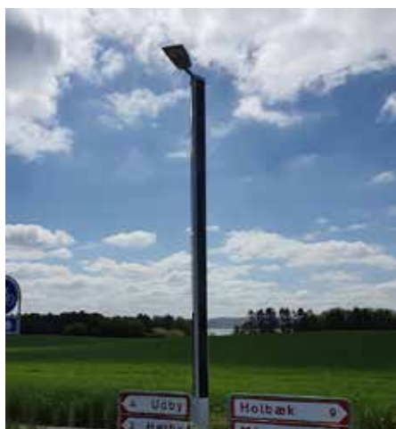
Suncil® Triangular Holbæk, Dinamarca